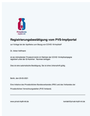
Muster der Registrierungsbescheinigung des PVS-Impfportals

Nach Prüfung der Daten durch die PVS-Verbands geschäftsstelle erfolgt eine Freischaltung für das Portal. Die Zugangsdaten werden per SMS und E-Mail zugesandt. Dieser Prozess kann bis zu drei Werktagen in Anspruch nehmen.