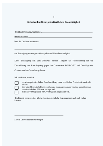
Muster der Selbstauskunft

Hierfür müssen die privatärztlich tätigen Personen zunächst eine ← Selbstauskunft gegenüber der jeweils zuständigen Landesärztekammer abgeben, auf der die Privatärztinnen und Privatärzte ihre niedergelassene Tätigkeit mit bestimmten Kriterien bestätigen müssen. Entsprechende Formular-Muster für die Selbstauskunft sind bei der jeweiligen Landesärztekammer erhältlich. Nach Eingang der Selbstauskunft, bescheinigt die Landesärztekammer unter Zugrundelegung dieser Selbstauskunft, dass die Person ein privatärztlich tätiges Pflichtmitglied bei der Landesärztekammer ist. Diese Bescheinigung,